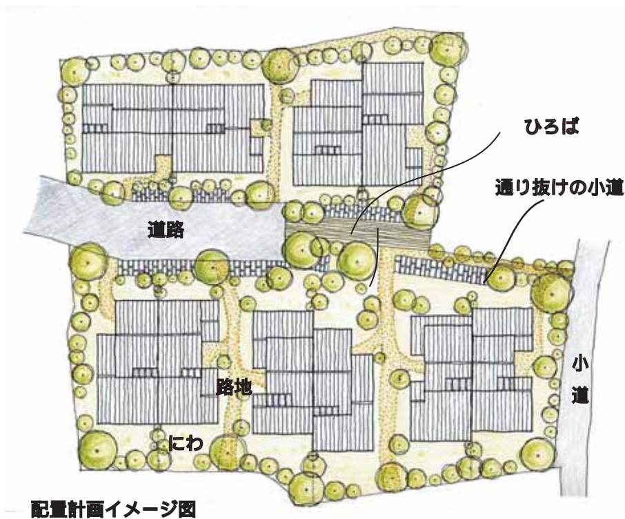
配置計画イメージ図